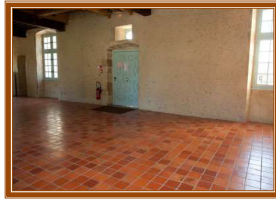
Terre cuite flammée et médiévaux