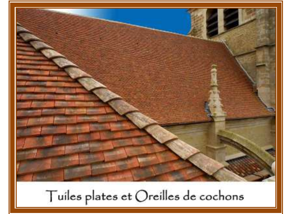
Tuiles plates et Oreilles de cochons

Depuis cinq générations à Soulaïnes Dhuis dans l'Aube. La Tuilerie ROYER transforme l'argile en Tuiles, Briques, Tommettes, Epis de faitage, Médiévaux, Poteries, Nichoirs à pigeons. Tous ces produits flammés dans un four à bois donnent à vos habitats les vertus de l'argile. La maîtrise du feu permet une variance des tons et des couleurs chatoyantes. Le dernier grand four à bois de France, une authentique passion des traditions.